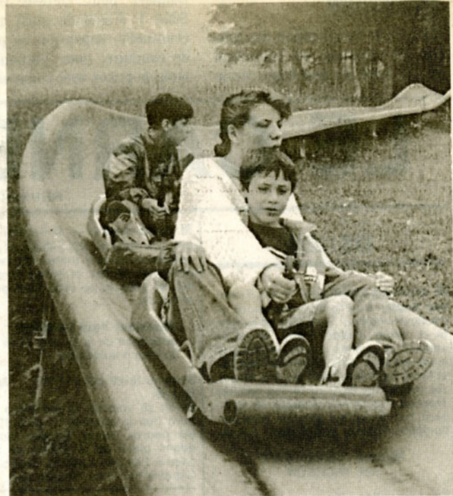
Bob-luge à travers la forêt